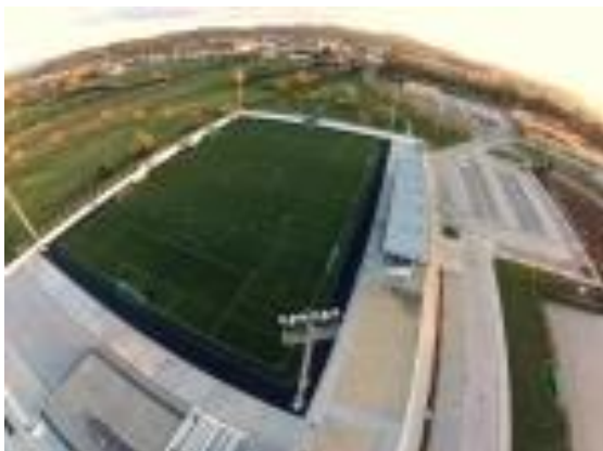
Campo 1 – Estádio Municipal Condeixa (Relvado Sintético)