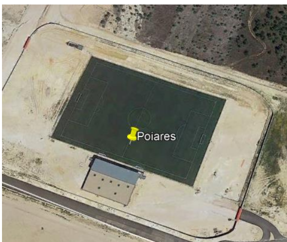
Campo 2 – Estádio Rui Lima – V. Nova de Poiares (Relvado Sintético)