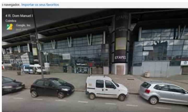
RESTAURANTE 39 – Estádio Cidade de Coimbra