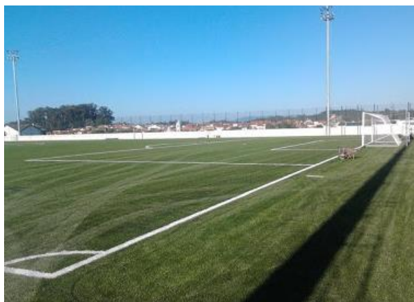
Campo 5 - Complexo desportivo de Ançã (Relvado Sintético)